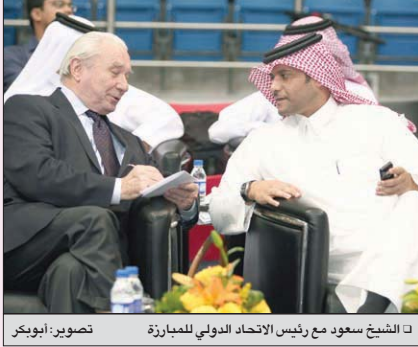
الشيخ سعود مع رئيس الاتحاد الدولي للمبارزة

ناقش مع رئيس الاتحاد الدولي مستقبل المبارزة الفطرية الشيخ سعود يعد بنقلة نوعية تنظيمياً ورياضياً في قادم السنوات